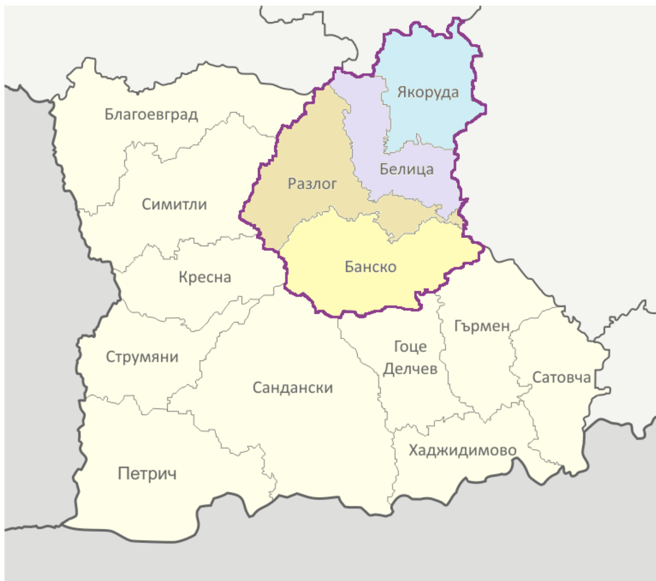
Фигура 1-01: Териториален обхват и граници на регион за управление на отпадъците Разлог