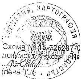
Схема № 15-725287-09.10.2018 г. издадена въз основа на документ, съвпадащ № 01-390675-09.10.2018 г.

Носители на други вещни права: няма данни