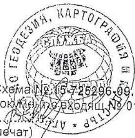
Схема № 15-725296-09.10.2018 г. издадена въз основа на документ, влизащ № 01-390675-09.10.2018 г.